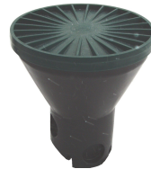
Колодязь розподільчий в зборі